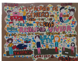
Escuela N° 111 Juana De Ibarbourou Mercedes

Iniciativa de Corresponsabilidad de Género en los Cuidados