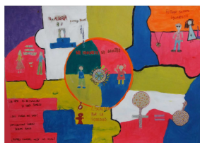
Escuela N° 16 Perseverano

Iniciativa de Corresponsabilidad de Género en los Cuidados