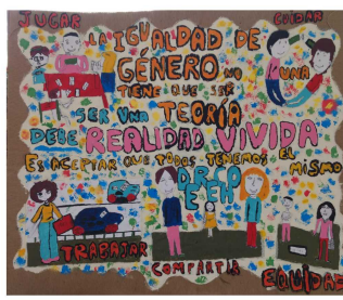
Escuela N° 111 Juana De Ibarbourou Mercedes