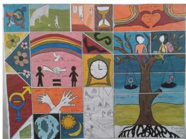
Escuela N° 49 Enrique Oyharzábal Pardías José Enrique Rodó