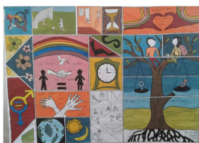
Escuela N° 49 Enrique Oyharzábal Pardías José Enrique Rodó

Iniciativa de Corresponsabilidad de Género en los Cuidados