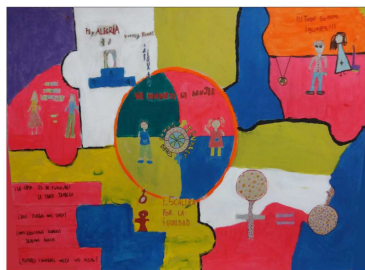
Escuela N° 16 Perseverano