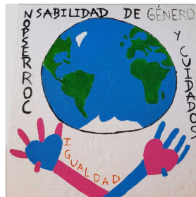
Escuela N° 63 Pueblo Castillos

Iniciativa de Corresponsabilidad de Género en los Cuidados Soriano 2018