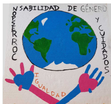
Escuela N° 63 Pueblo Castillos

Iniciativa de Corresponsabilidad de Género en los Cuidados